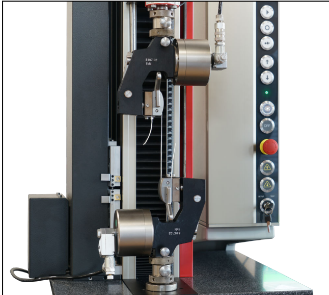
Umlenk-Probenhalter Typ 8197 Fmax 1 kN, pneumatisch