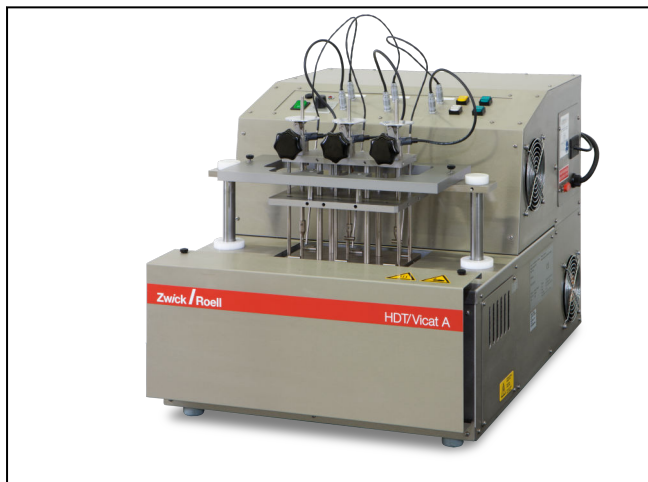
HDT/Vicat 3-300 A1 mit 3 Messstationen